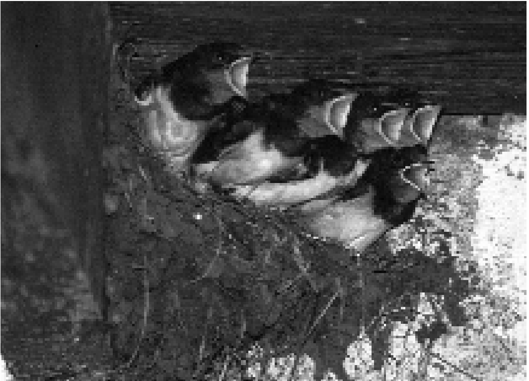
Nest met bijna vliegvlugge jongen in kleine stal (Bennie van den Brink). Door bedrijfsbeëindiging verdwijnen deze in rap tempo, terwijl ze juist een veilige en beschutte broedomgeving vormen met hoge jongenproductie. Nest with near-fledged Barn Swallows in a small stable. Closure of farms causes such safe and sheltered breeding sites, where swallows raise most young, to disappear rapidly.

In 1992 waren er in Nederland 36 800 melkveehouders, in 2000 nog 25 800 (CBS Statline). In de komende jaren zal deze sector naar verwachting nog slinken met minimaal 20-30% (Jonkers 2001). De sluiting van melkveebedrijven is ongunstig voor zwaluwen, doordat gebouwen veelal een andere bestemming krijgen en worden afgesloten, maar ook vanwege de afwezigheid van het vee zelf. Møller (2001) vergeleek aantallen en broedsucces van Boerenzwaluwen op melkveebedrijven in Denemarken voor en na bedrijfsbeëindiging. Na het verdwijnen van het vee nam het aantal broedparen met de helft af, werden de legfels kleiner en werden minder tweede legfels geproduceerd, zodat de jongenproductie van de overgebleven broedparen daalde. Deze veranderingen bleven uit op bedrijven waar een veestapel aanwezig bleef. Naast het gunstige microklimaat in stallen met vee kunnen deze veranderingen zijn veroorzaakt door effecten op het voedselaanbod: de dichtheid van vliegende insecten op en rond het erf nam af waar het vee werd opgedoekt.