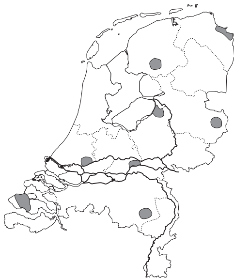
Figuur 1. Ligging van de onderzoeksregio's in het Boerenzwaluw Project Nederland. Map showing the locality of study areas in The Netherlands.

Om een beeld te krijgen van ontwikkelingen in de broedvogelstand van de Boerenzwaluw startte de Nederlandse Ringcentrale in 1992 het Boerenzwaluw Project Nederland. Dit project is in 1998 opgegaan in het Euring Swallow Project , waarbij in een twintigtal Europese landen op gestandaardiseerde wijze onderzoek aan de Boerenzwaluw plaatsvindt. Het Nederlandse project wordt door de meeste medewerkers tot op heden voortgezet, maar voor dit artikel zijn gege-