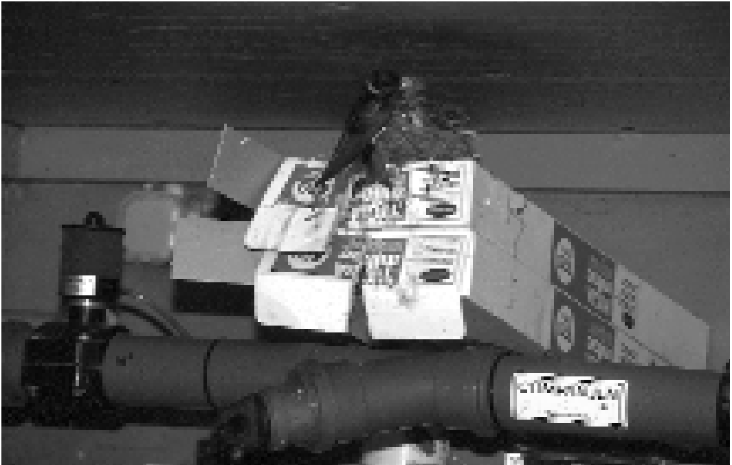
Zwalwnest, gemaakt op een kartonnen doos in een koelruimte. Hygiënemaatregelen moeten dit voorkomen. Barn Swallow nest on a cardboard box in a milkhouse. Hygiene measures aim to prevent this.

duidelijk aan dat kleine broedruimten voor Boerenzwaluwen een hogere jongenproductie opleveren. Dat komt niet doordat in kleine gebouwen meer of grotere legfels worden geproduceerd, maar doordat de eieren en/of de jongen daar beter overleven.