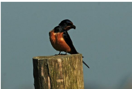
Fase 4. 25 april 2012 Ouderkerk aan de IJssel (Z.H.)