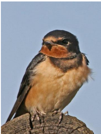
Fase 2. Foto: Ineke Berger. © 4 juni 2011 Kockengen (U.)