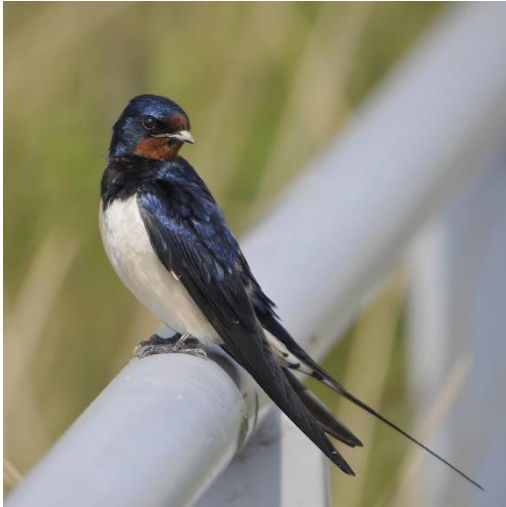
Fase 0. 15 april 2011 Zevenhuizen (Z.H.)

een ander gebied is. Dit is echter nooit het geval, het betreft in alle gevallen een kleurvariant van dezelfde soort: Hirundo rustica rustica .