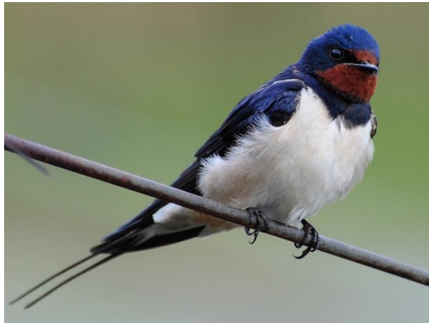
Fase 1. Foto: Koos Bakker. © 29 mei 2010 Zwanenwater (N.H.)