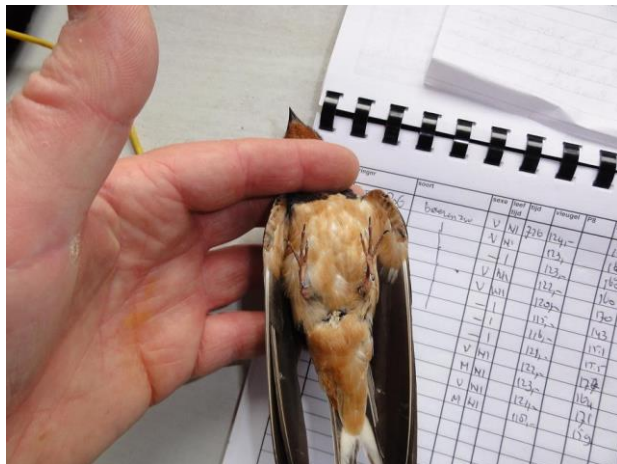
Fase 3. Foto: Jan de Jong. © 27 juli 2011 Terwispel (Fr.)